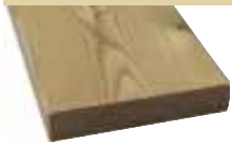
20x90mm 510cm 3,30 €/Meter