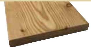
26x190mm 510cm 7,90 €/Meter