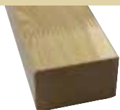
44x68mm 510cm 4,50 €/Meter