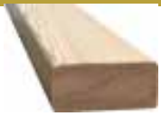
20x45mm 510cm 1,70 €/Meter