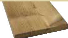
20x140mm 400,510cm 4,20 €/Meter