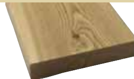
26x140mm 400,510cm 5,50 €/Meter